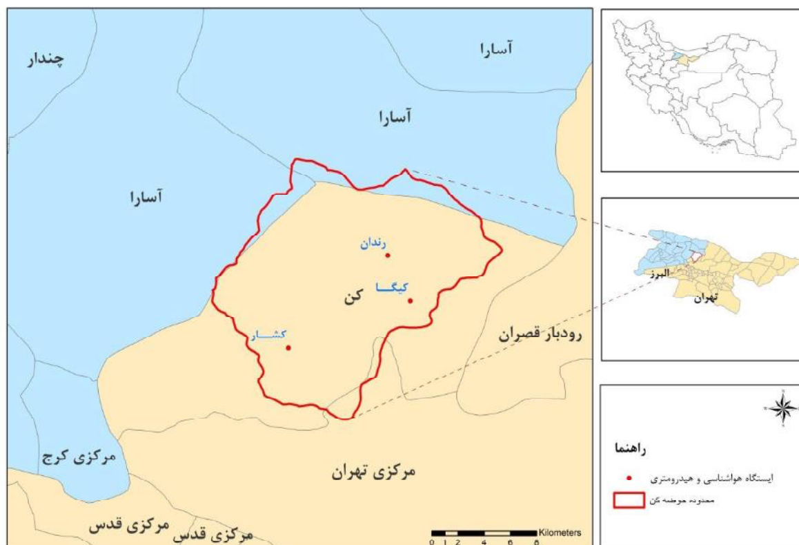
شکل ۱. موقعیت حوضه کن و ایستگاه‌های محدوده مطالعه شده در ایران و تهران

حوضه کن با مساحت تقریبی ۲۰۰ کیلومترمربع در